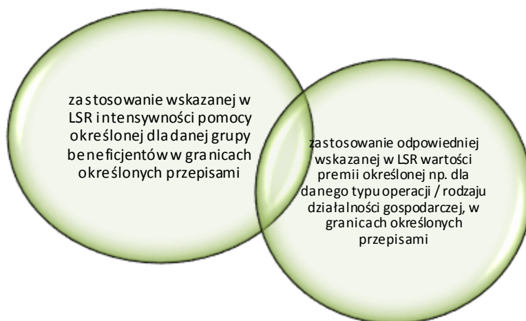
Rysunek 2. Zasady określania kwoty wsparcia.