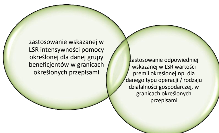
Rysunek 2 Zasady określania kwoty wsparcia.